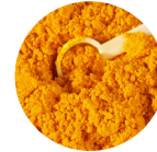
Pantotheenzuur (vitamine B5)